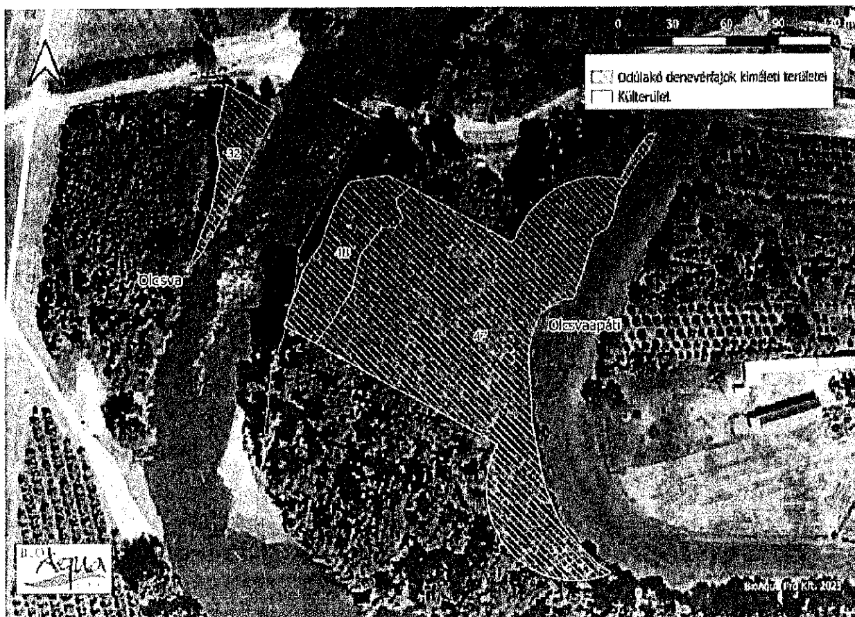
1. ábra Odúlakó denevérfajok által potenciálisan érintett területek (6.4. - F90 nyomvonal)